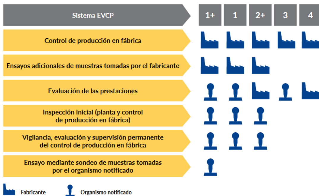
Fig.4: Sistemas de evaluación y verificación de la constancia de las prestaciones (sistemas EVCP)

Dentro del marco del Reglamento UE nº 305/2011 del Parlamento Europeo y del Consejo de 9 de marzo de 2011, por el que se establecen condiciones armonizadas para la comercialización de productos de construcción , se establecen los siguientes Sistemas de Evaluación y Verificación de la Constancia de las Prestaciones (queda especificado en la normativa armonizada qué sistema es de aplicación a cada producto):