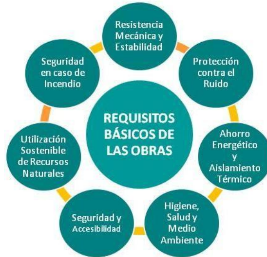
Fig.3: Requisitos básicos del Mercado CE según el Reglamento de Producto de la Construcción nº305/2011 del Parlamento Europeo y del Consejo de 9 de marzo de 2011

seguridad de las personas afectadas a lo largo del ciclo de vida de las obras. Estos requisitos básicos establecidos son: