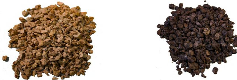
Fig.1: Imágenes de granulado de corcho natural y expandido

El corcho se utiliza en distintos formatos y en forma de diferentes productos comercializados; en el presente documento se abordará el corcho granulado, bien natural o bien expandido.