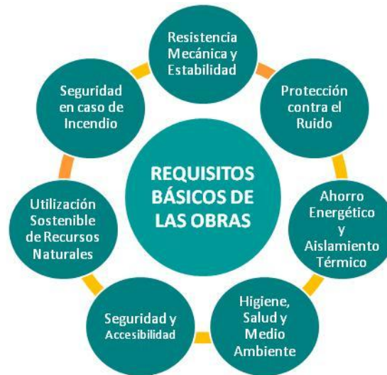
Figura 4: Requisitos básicos del Mercado CE según el Reglamento de Producto de la Construcción nº305/2011 del Parlamento Europeo y del Consejo de 9 de marzo de 2011